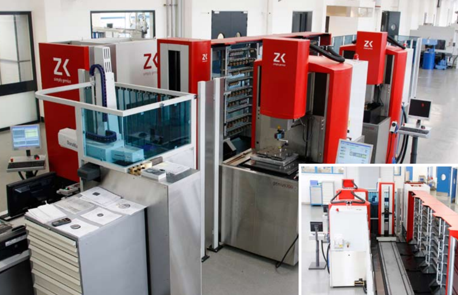
Eine homogene Gesamtanlage: Das Chameleon Handlingsystem, zwei Senkerodiermaschinen genius 700, einer als Übergabestation voll eingebundenen Transclean Reinigungsstation und eine Messmaschine von Zeiss.