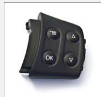
7 Von starlim//sterner entwickelt, gefertigt und produziert: Ein Lenkradschalter für die Automobilindustrie.

Mühlstraße 21, A-4614 Marchtrenk Tel. +43 7243-58596-0 www.starlim-sterner.com