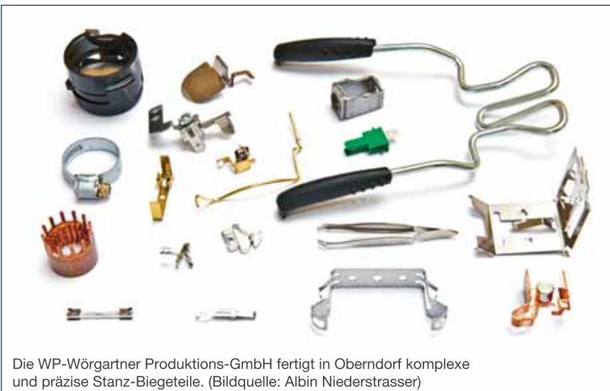
Die WP-Wörgartner Produktions-GmbH fertigt in Oberndorf komplexe und präzise Stanz-Biegeteile.

Als ein paar Jahre später die Erweiterung um eine zusätzliche Maschine anstand, konnte Anton Köller, damals bereits Produktmanager, den gewünschten Liefertermin nicht ruhigen