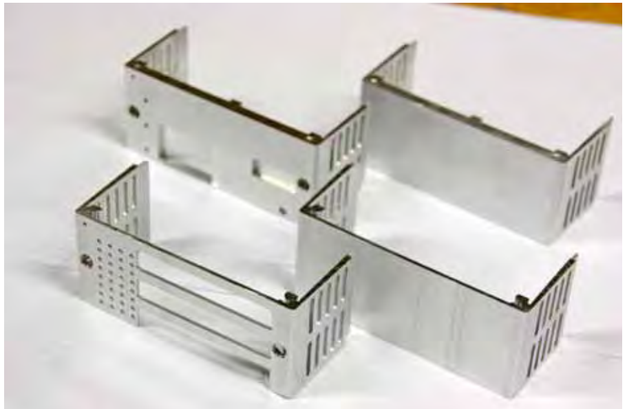
An den sehr dünnwandigen Teilen müssen zahlreiche Operationen durchgeführt werden. Da spielt in der mechanischen Bearbeitung ein schneller Werkzeugwechsel und dynamische Verfahrswege, sowie beim Handling eine ausgeklügelte Greifertechnologie eine entscheidende Rolle.

Viel Intelligenz steckt in den Vierfach-Aufspannvorrichtungen in den Maschinen selbst. Diese sind so gestaltet, dass sie für alle möglichen Varianten der Modulgehäuse und für deren Bearbeitung von vorne und hinten ohne Umspannen geeignet sind. Da dieselbe Aufspannvorrichtung für alle Produkte stets in der Maschine bleiben kann, erfolgt die Umstellung von einem Modultyp zum Nächsten ausschließlich per Programmwechsel. So kann innerhalb weniger Sekunden gewechselt und die Produktion der Elektronikmodule bereits von den Gehäuseteilen an nachfragegerecht, im Extremfall sogar auftragsbezogen erfolgen. Ebenfalls Teil der Anlage ist eine Messvorrichtung, in die der Roboter